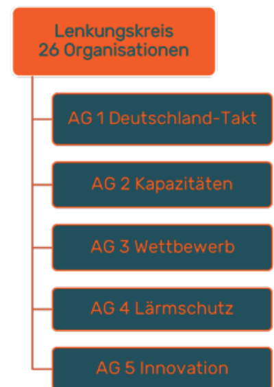
In fünf Arbeitsgruppen wird die Arbeit des Zukunftsbündnisses geleistet.