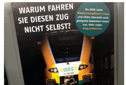
Leute wie er sind sehr gefragt.