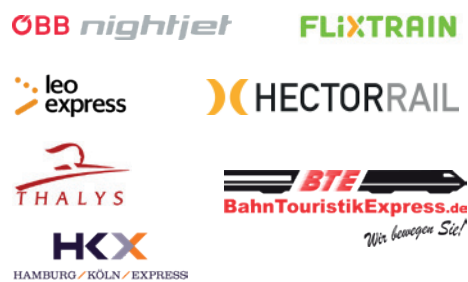
Einige der aktuellen Mitbewerber der DB Fernverkehr.

Das Auslaufen der Rahmenverträge wird alle Zugangsberechtigten treffen. Der SPFV ist besonders zu betrachten.