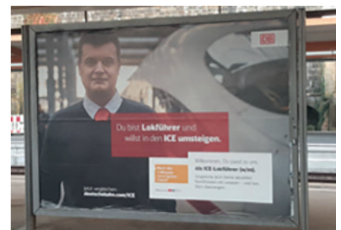
Am besten gleich selbst steuern: Suche nach Lokführern bei der Ostdeutschen Eisenbahngesellschaft.