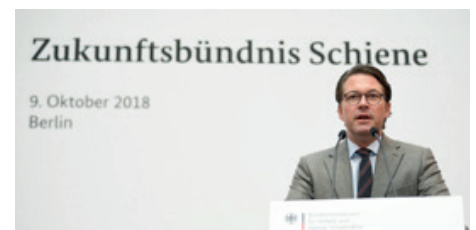
Gab auch formal den Startschuss für das Zukunftsbündnis: Verkehrsminister Andreas Scheuer.

mofair unterstützt den Ansatz, mit dem „Zukunftsbündnis Schiene“ viele bereits vorhandene Einzelprojekte zu bündeln und eine Gesamtstrategie für die Schiene zu entwickeln. Allerdings darf die Debatte nicht ausufern, sondern sollte zu klaren Empfehlungen für die Politik führen.