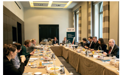
Wie die Infrastrukturqualität besser werden kann, war Thema bei einem Parlamentarischen Frühstück von mofair Anfang Mai.