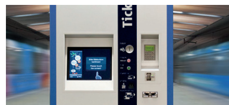
Häufig anzutreffen: Fahrausweisautomaten aus dem Hause ICA.