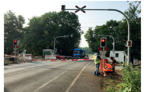
Besonders problematisch in manchen Bundesländern: Defekte Bahnübergänge.

Ebenso wichtig ist, dass die Verspätungsursachen künftig nicht nur durch die DB Netz erfasst, sondern auch regelmäßig veröffentlicht werden. Nur so können die richtigen Schlüsse gezogen werden. Schließlich braucht es gesetzliche Anreize, das Netz anhand des zu erwartenden Bedarfs kontinuierlich weiterzuentwickeln – auch jenseits der großen Ausbaumaßnahmen. Die Zahl der amtlich für „überlastet“ erklärten Strecken und Bahnhöfe steigt kontinuierlich an. Daraus folgt aber nichts. Im Gegenteil: § 35 Abs. 1 ERegG regelt, dass der Infrastrukturbetreiber Aufschläge auf das reguläre Trassenentgelt verlangen kann, wenn Schienenwege überlastet sind – ein fatales Signal.