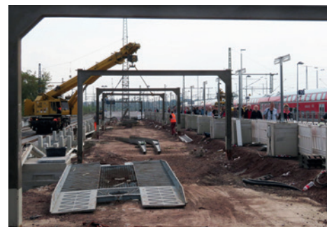
Auch Bahnhöfe müssen erneuert werden. Wenn Bahnsteige eine Weile nicht zur Verfügung stehen, hat das auch Auswirkungen auf die Pünktlichkeit.