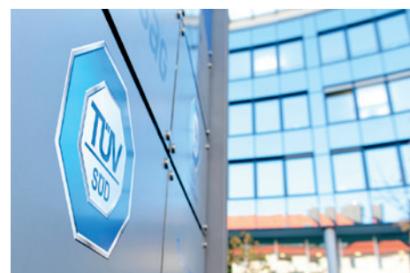
Der TÜV-Süd Firmensitz in München.