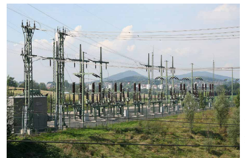
Ein solches Unterwerk ist Teil des Bahnstromnetzes.

Die Bahnstrominfrastruktur (Mitte) ist natürliches Monopol, Wettbewerb kann auf Lieferantenseite (Stromlieferanten) und auf der Abnehmerseite (Eisenbahnverkehrsunternehmen) stattfinden.