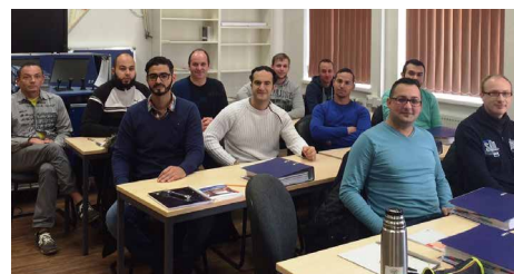
Seiteneinsteiger während eines Schulungskurses für Triebfahrzeugführer.

Der VRR würde mit der abrupten Kündigung des Vertrags mit Keolis in zweierlei Hinsicht einen Präzedenzfall schaffen: Zum ersten Mal würde ein Verkehrsvertrag vor Betriebsaufnahme gekündigt; und zum ersten Mal würde ein Verkehrsvertrag aus einem Grund gekündigt werden, der alle EVU gleichermaßen betrifft. Vor allem beunruhigt eine solche Vorgehensweise den Markt für händleringend gesuchtes Personal zusätzlich und konterkariert die bisherigen Maßnahmen.