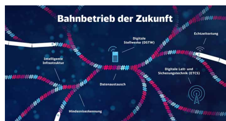
Die Digitalisierung der Eisenbahn bietet mannigfaltige Möglichkeiten – alle Partner müssen gemeinsam und gleichberechtigt für diese Vision arbeiten.