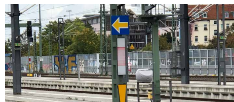
Wo man den gelben Pfeil auf blauem Grund sieht, wie hier am Hauptbahnhof in Erfurt, ist ETCS bereits verbaut.

Vor allem liegt die Finanzierung der Fahrzeugumrüstung während der Rolloutphase in der Verantwortung des Bundes. Die Gesamtkosten liegen laut Gutachter bei 32 Mrd. Euro über den Gesamtzeitraum bis 2040. Wer von 28 Mrd. Euro spricht, klammert die Fahrzeugumrüstung aus und riskiert damit den Erfolg dieses Jahrhundertprojekts. Wenn der Bund die Umrüstung nicht finanziert, müsste sie von den Ländern getragen werden. Die Folge wäre, dass dann weniger Züge fahren können statt mehr. Die durch ETCS ermöglichte Mehrkapazität würde nicht genutzt, weil die Mehrleistungen nicht finanziert werden könnten. Es kommt nun darauf an, dass der im Haushaltsentwurf vorgesehene Titel für „Infrastruktur und Rollmaterial“ zur ETCS-Ausrüstung entsprechend ausgestattet wird.