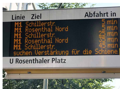
Auch bei der „Light Rail“ wird Personal gesucht – hier sucht die BVG über den „Daisy“-Anzeiger.